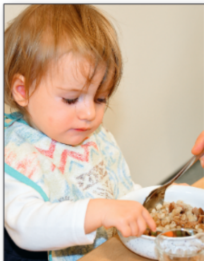
Toucher le nourriture et manger avec les doigts sont deux phases préliminaires pour les enfants. L'enfant apprend à se mouvoir lui-même et à goûter les aliments. Il les aime naturellement quand il passe et l'adulte.

Conçu comme un guide pratique, cet ouvrage fournit de nombreuses pistes pour l'organisation des repas à la crèche. Il aborde l'apprentissage de l'alimentation et de la boisson en montrant comment accompagner ces processus dans un cadre institutionnel, notamment en éveillant l'intérêt pour les nouveaux aliments chez les tout-petits, en cultivant une atmosphère bienveillante envers les nouveaux venus avec des aliments « apaisants », et en conjuguant avec succès les aspects relationnels et organisationnels liés aux repas.